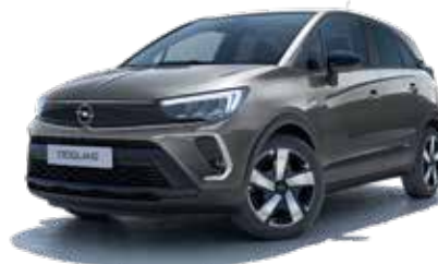
Moonstone Grey Top-to-tyre 2