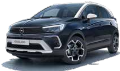
White Roof On Diamond Black 3

The roof, the headlights, the flowing contours ... the Crossland turns heads for all sorts of reasons and the striking colours play a big part. Here are three of our favourites mixes. What's yours?