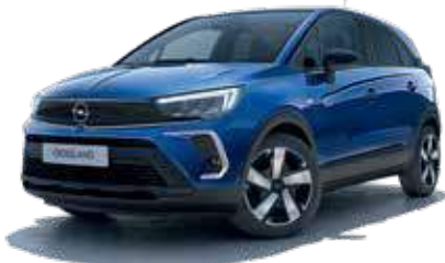
Navy Blue 2