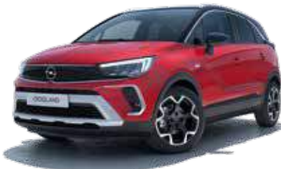
Black Roof On Hot Red 4