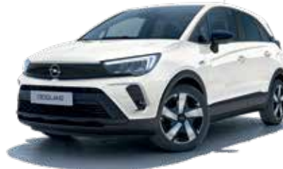
White Jade 4