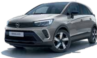
Quart Grey 2