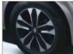
16" ALAYA Twin Color Alloy Wheels