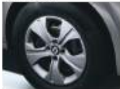
15" TERA Steel Wheels