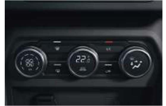
Automatic A/C تكييف هواء أوتوماتيكي