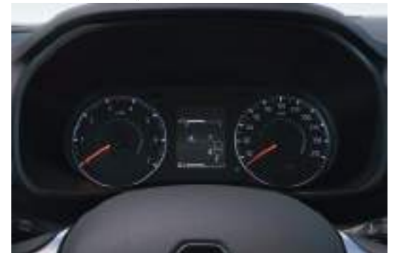
4.2" Digital Cluster Screen شاشة عدادات ديجيتال ٤/٢ بوصة