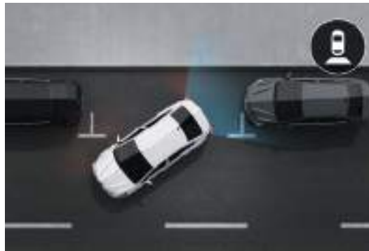
Rearview Camera كاميرا خلفية