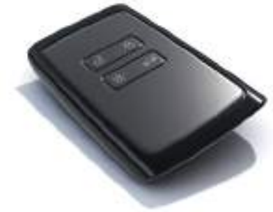
Keyless Entry System (Renault Smart Card) نظام دخول السيارة بدون مفتاح (كارت رينو الذكي)