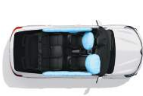
4 Airbags (Front and Side) ٤ وسائد هوائية (أمامية - جانبية)