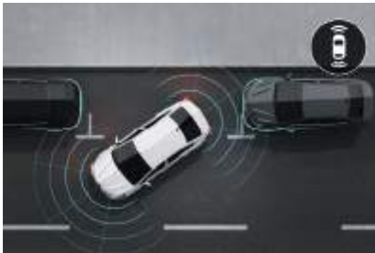
Rear & Front Parking Sensors حساسات ركن خلفية وأمامية