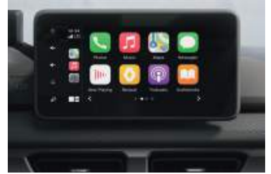
Apple CarPlay & Android Auto Support تدعيم أنظمة هواتف آبل وأندرويد