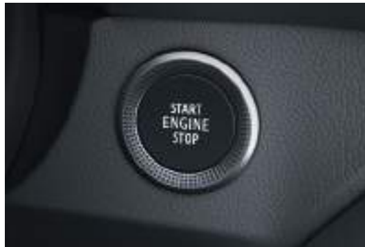
Keyless Engine Start/Stop نظام تشغيل المحرك بدون مفتاح