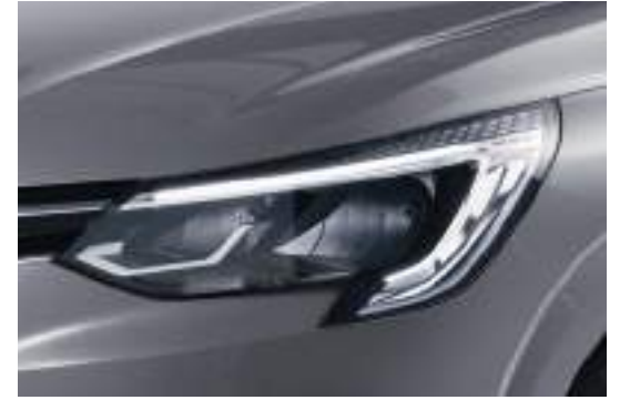
C-Shape LED Daytime Running Light إضاءة نهائية LED تعمل عند تشغيل المحرك