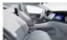
جلد رمادي فاتح / بني Leather navy grey / balsa brown