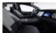
جلد أسود / رمادي Leather black / space grey