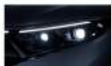
إضاءة أمامية Digital Headlamps, Digital Light