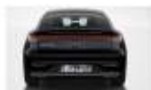
مصباح خلفي بتقنية LED LED Tail lights