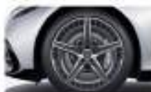
تصميم متفرد البراميل 21 بوصة 21-inch AMG 5-spoke light- alloy wheels