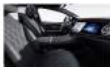
جلد طبيعي السمود / رمادي Nappa leather AMG black / space grey