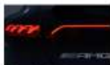
مصباح خلفي بتقنية LED LED tail lights