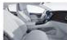
جلد رمادي فاتح / كحلبي Leather rose grey / biscay blue