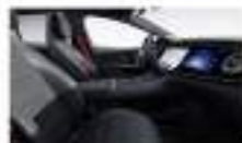
جلد طبيعي أسود / رمادي Nappa leather AMG black / space grey