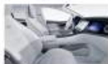
جلد طبيعي رمادي فاتح / كحلي Nappa leather AMG nova grey / biscay blue