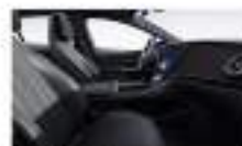
جلد أسود / رمادي Leather black / space grey