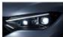
إضاءة أمامية Headlamps, Digital Light