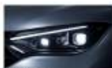
إضاءة الرامات Headlamps, Digital Light