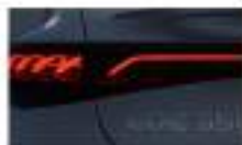
مصباح خلفي خلفي بلدي LED Tail lights