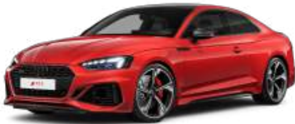
Progressive Red Metallic