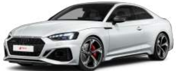
Glacier White Metallic