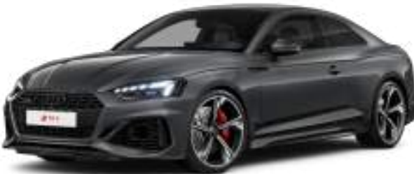
Daytona Gray Pearlescent