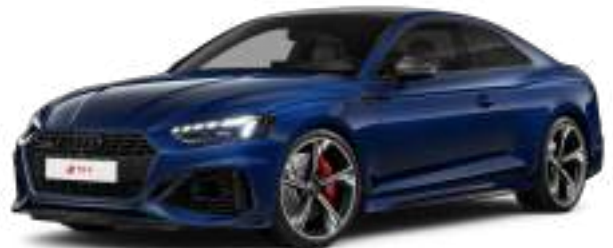
Navarra Blue Metallic