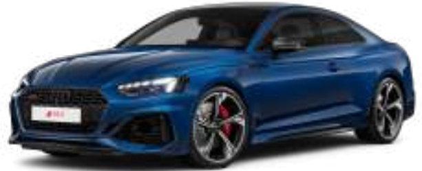
Ascari Blue Metallic