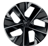
18" Diamond-Cut Epherra Wheels (Orbital Black)