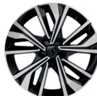
17" DIAMOND CUT ALLOY WHEELS