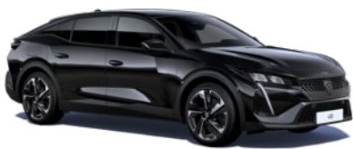
Black Perla Nera