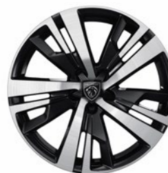
18" Diamond Cut Alloy Wheels