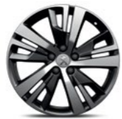
18" Alloy Detroit