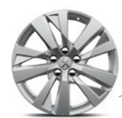
17" Alloy Chicago