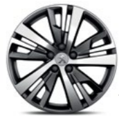
18" Alloy Detroit