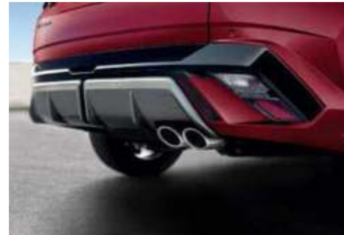
N Line-Exclusive Single Twin Tip Muffler