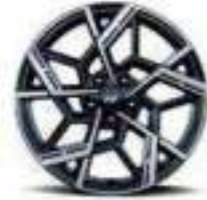
19" alloy wheels (N-Line)