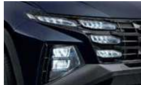
Full LED Headlamps (MFR Type)