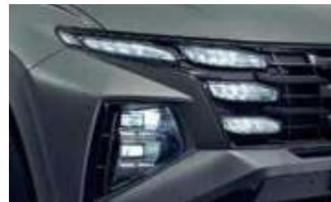
Full LED Headlamps (Wide Projection with IFS Function)