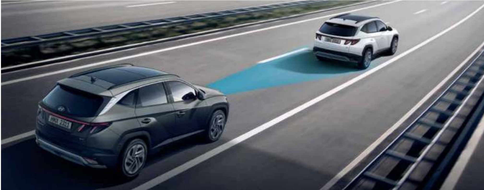
Smart Cruise Control (SCC) Smart Cruise Control (SCC) helps maintain distance from the front vehicle and drive at a speed set by the driver. Automatically stops when the front vehicle stops and automatically starts when the front vehicle departs within a short time.