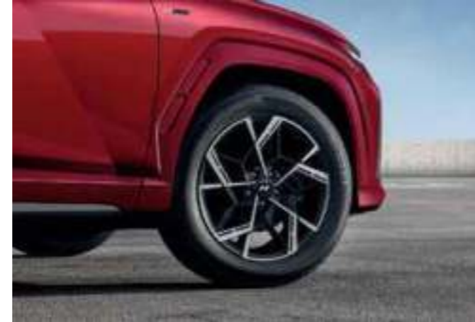
N Line-Exclusive 19-inch Alloy Wheels / Body-color Cladding