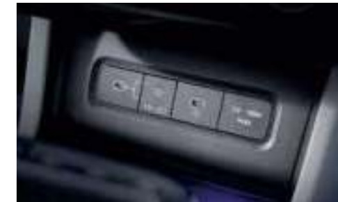
USB-C Data/Charging Ports