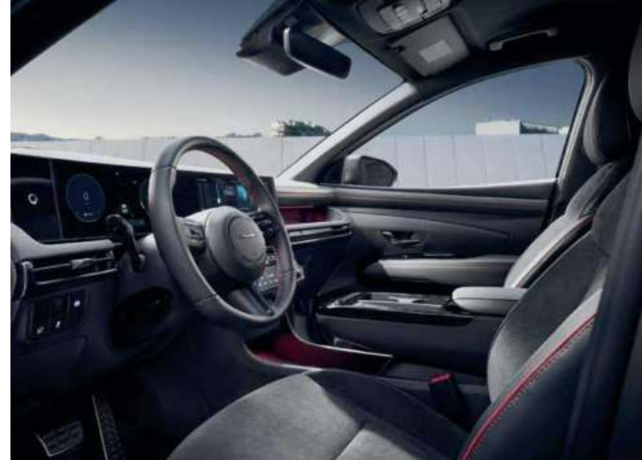
N Line-Exclusive Interior (N Line Emblem Steering Wheel / Red Stitching)