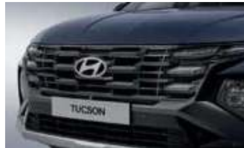
Dark Metal Paint Radiator Grille (Clear Type DRL)