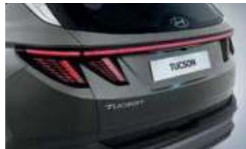
LED Rear Combination Lamps