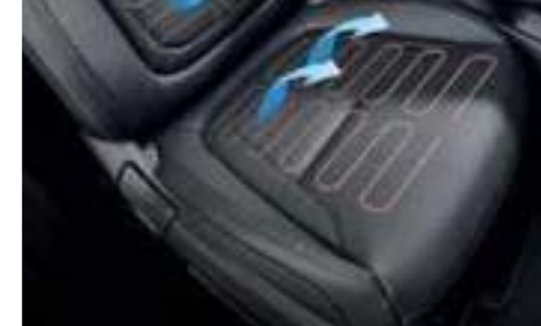
Front Ventilated Seats