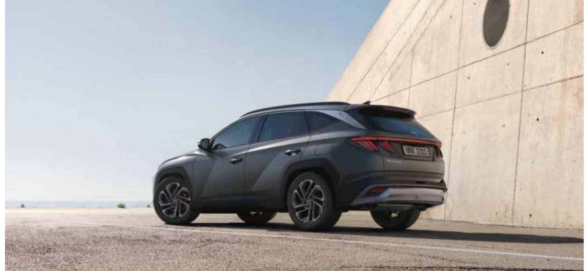
Parametric Jewel Surfaces