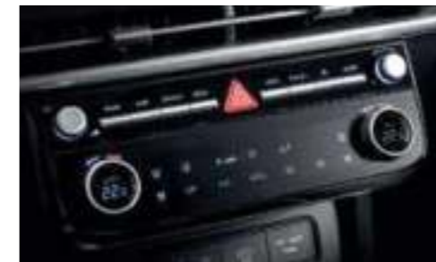
Full Auto Air Conditioning System