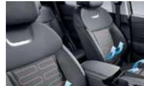
Front Ventilated Seats