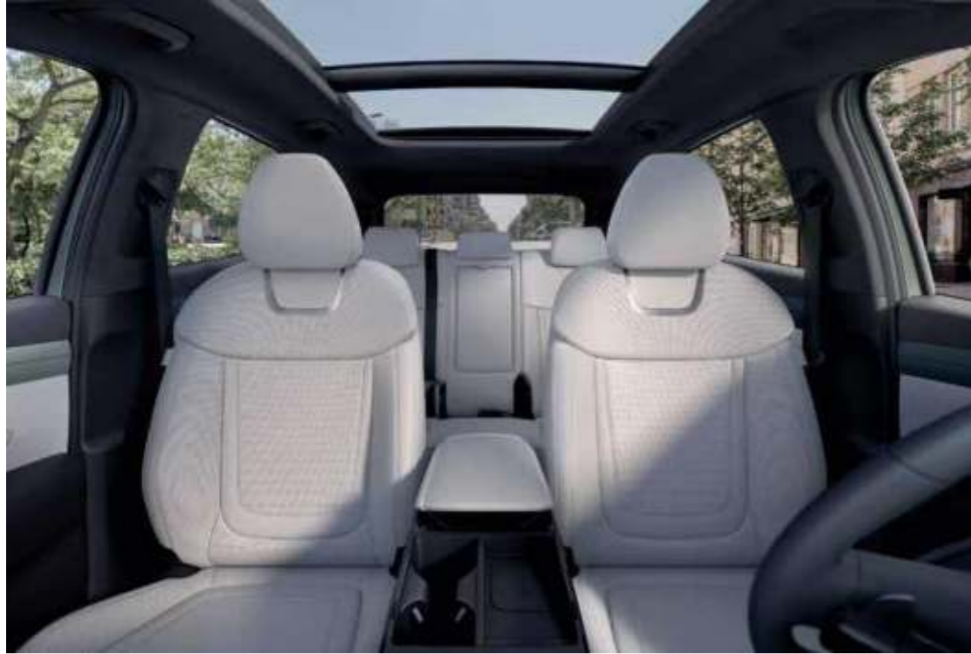
1st & 2nd Row Seat

Make room for more. Its best-in-class cargo space and roomy interior support various lifestyles and activities, offering more versatility than ever.