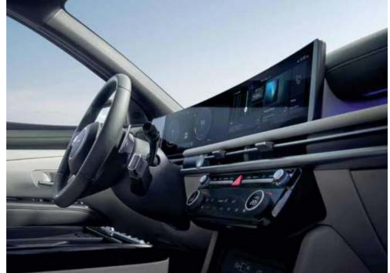
Panoramic Curved Display 12.3-inch (Cluster) + 12.3-inch