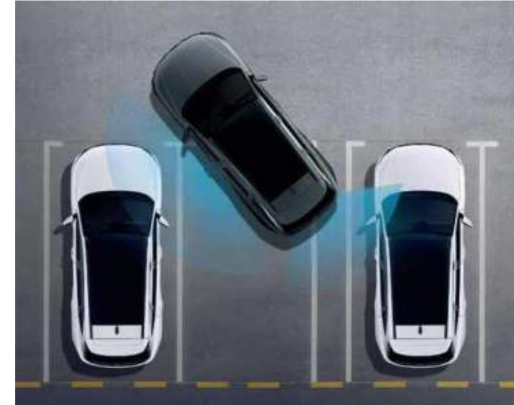
Forward/Side/Reverse Parking Distance Warning (PDW) Forward/Side/Reverse Parking Distance Warning (PDW) warns against collisions with objects around the vehicle at low speeds.