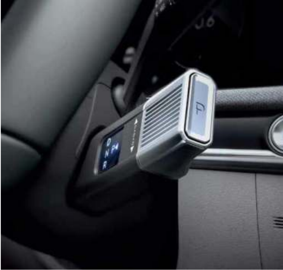
Column-type Shift by Wire (SBW)