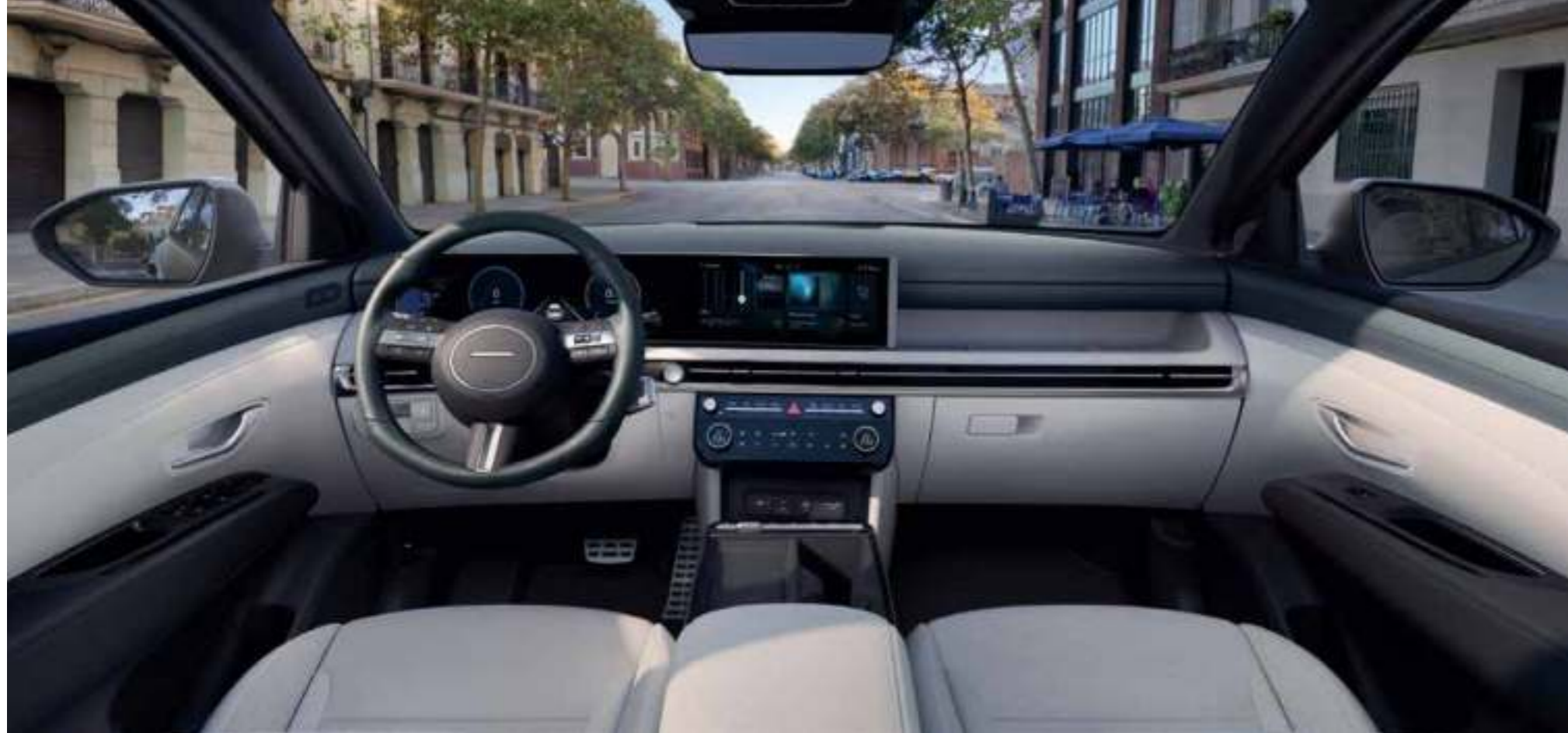
Wrap-Around Architecture Design

The cabin's wide horizontal design wraps around the interior, enveloping the passengers with a seamless architecture that integrates technology and style.