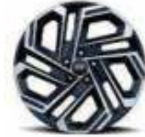
19" alloy wheels (Optional)