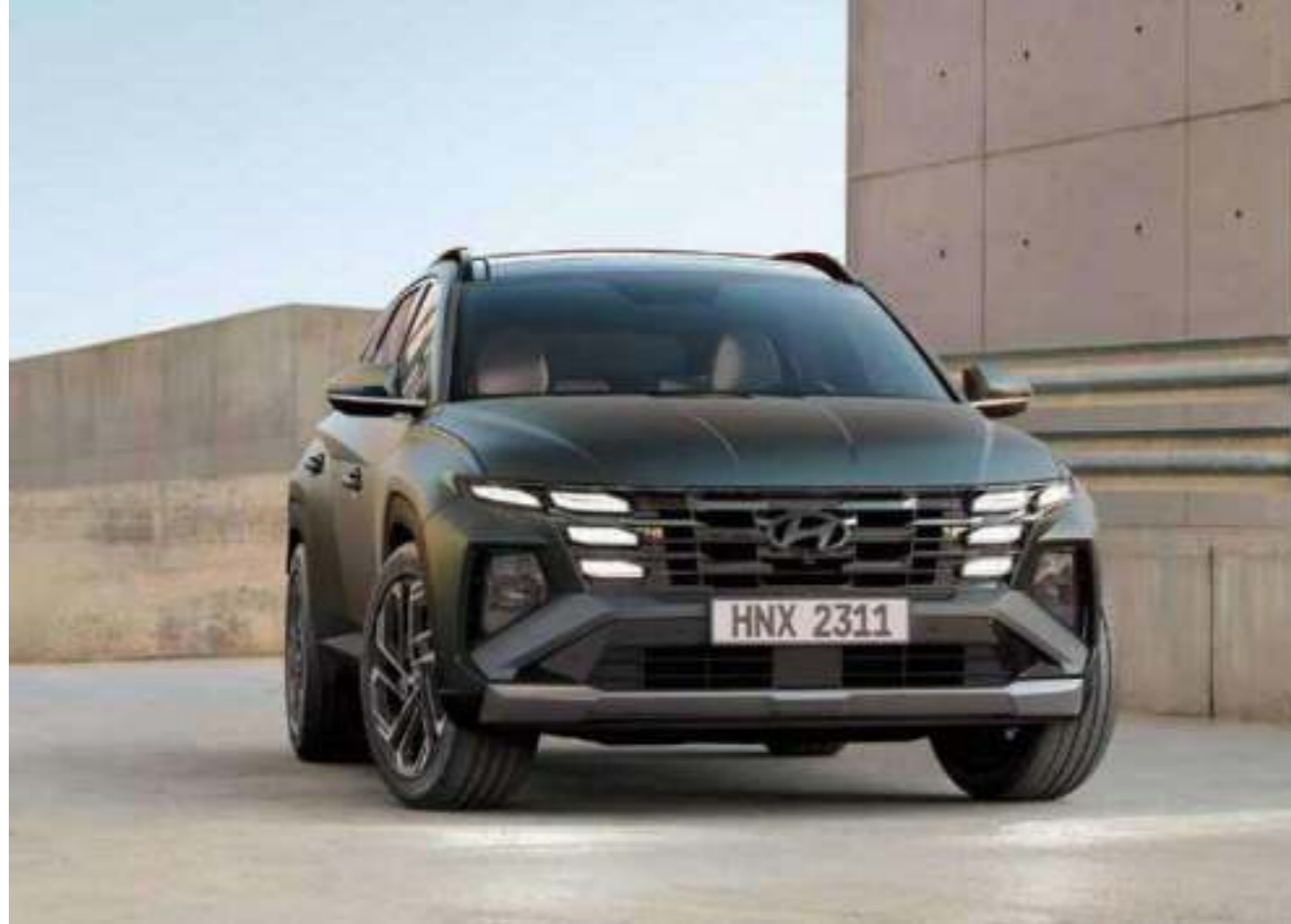
Parametric Jewel Hidden Signature Lamps

Reject the ordinary with eye-catching jewel-like elements of the front lamps as well as around the sides - boldly upgraded to allow you to stand out from the crowd.