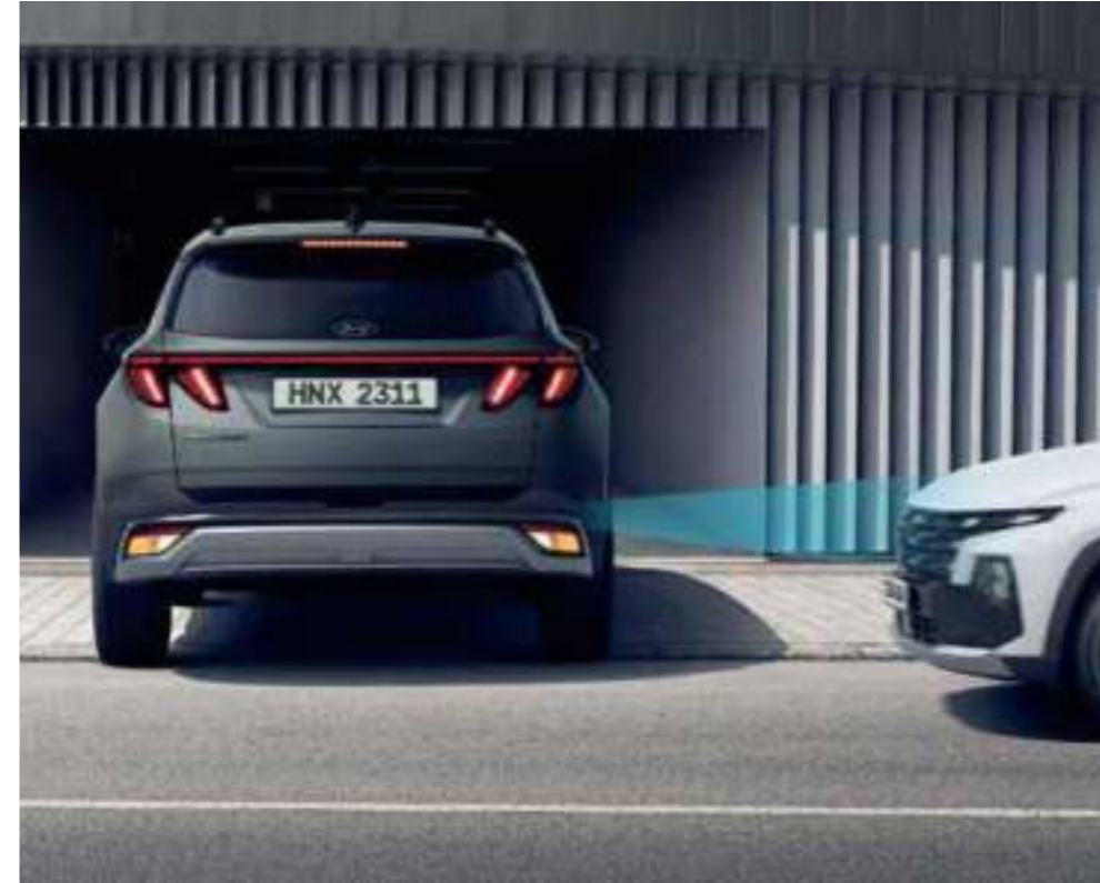
Parking Collision Avoidance Assist (PCA) Reverse Parking Collision Avoidance Assist (PCA) provides a warning if there is a risk of collision with a rear object while reversing. After the warning, if the risk of collision increases, it automatically assists with emergency braking.