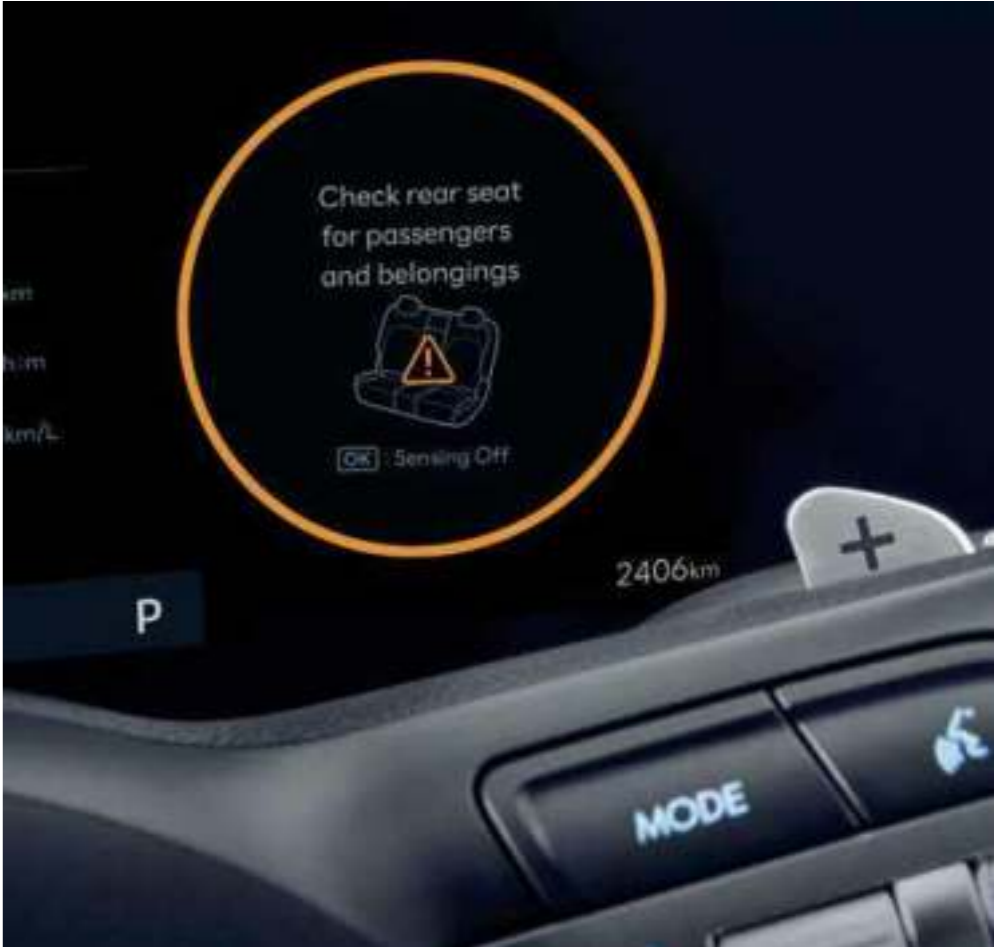
Rear Occupant Alert (ROA)