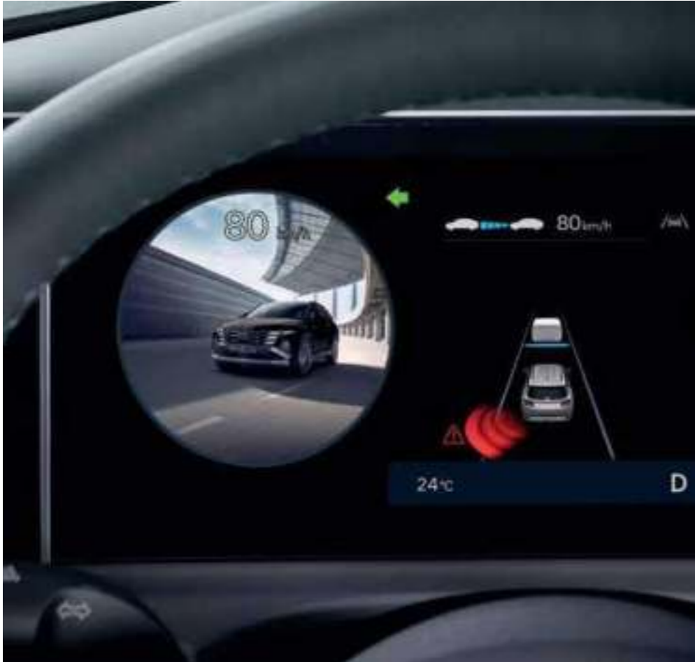
Blind-Spot View Monitor (BVM)

The new TUCSON is packed with reliable features to protect you from the unexpected and ensure you leave no one behind.