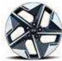
18" alloy wheels (Standard)