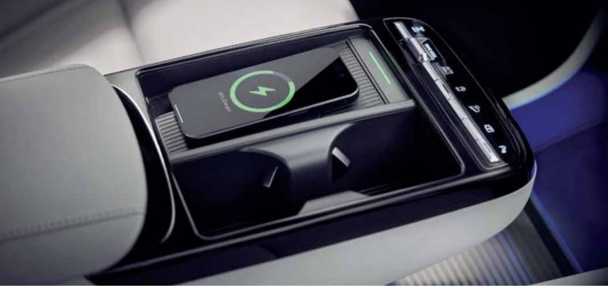
Wireless Power Charger (WPC)

A reinvented layout with a host of intuitive technologies that enable an effortless and convenient on-the-road experience.