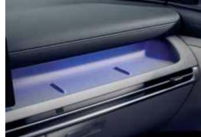
Ambient Mood Lamp / Multi-tray