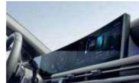
12.3" TFT-LCD Cluster Screen