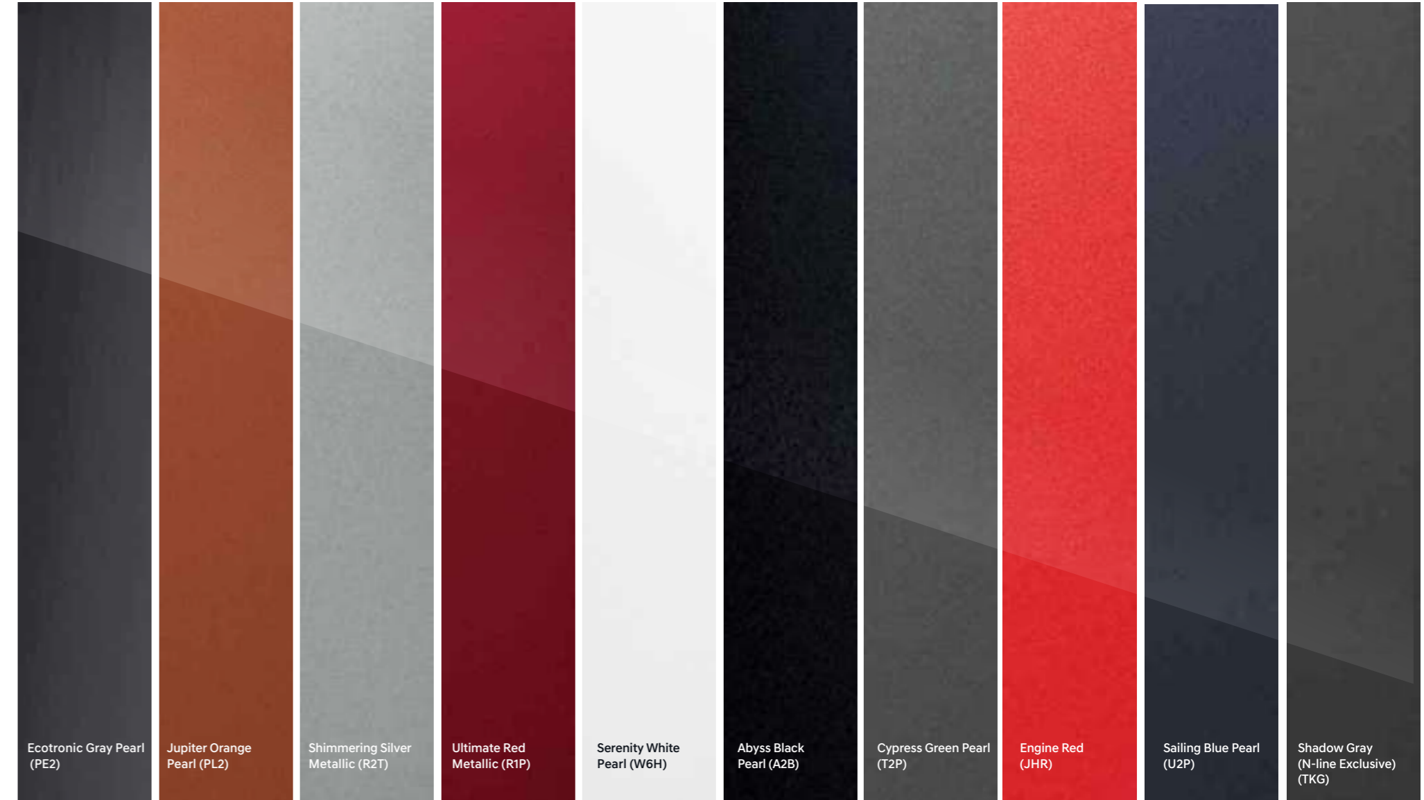
Ecotronic Gray Pearl (PE2)