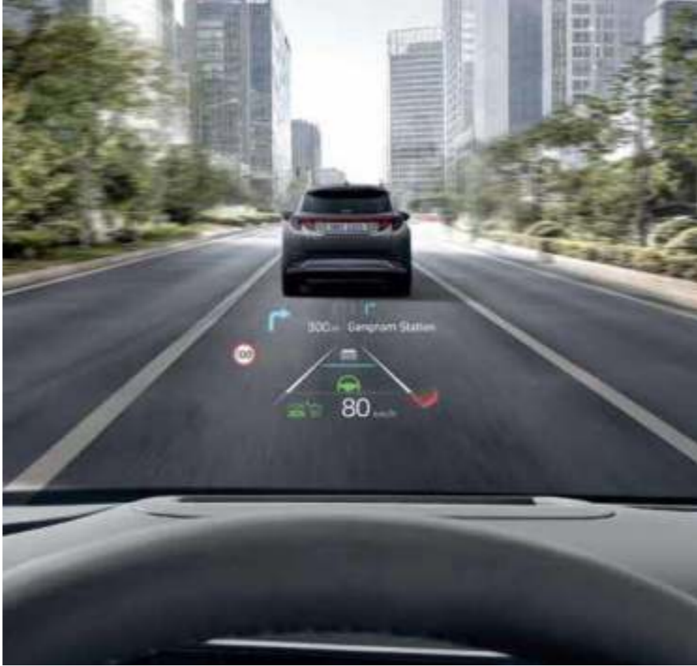
12-inch Head-up Display (HUD)