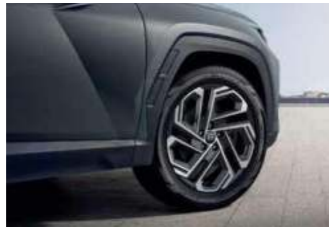
19-inch Alloy Wheels