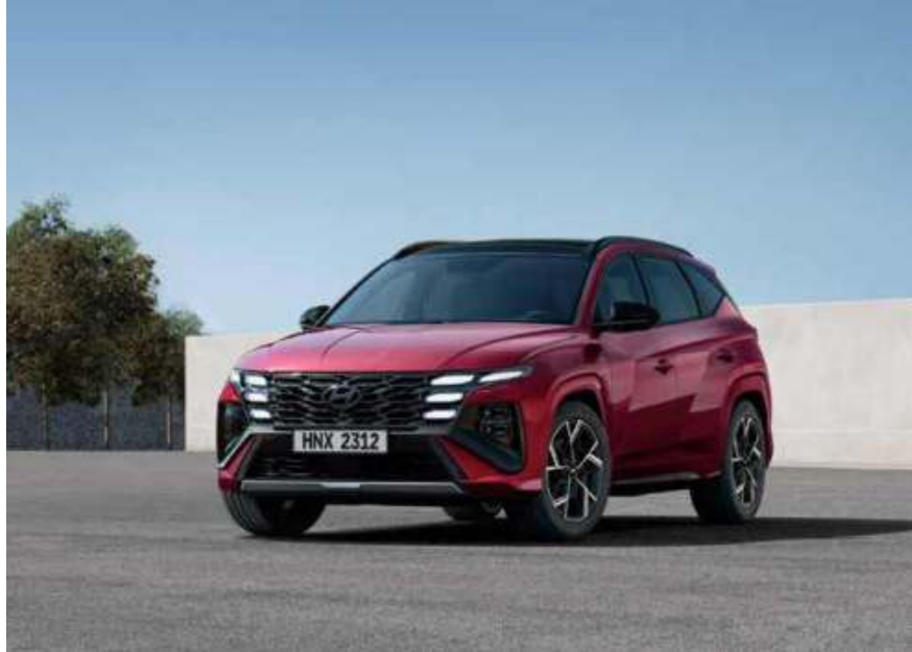
N Line Exclusive Radiator Grille

Packaged with an exclusive design, the new TUCSON N Line awaits those who desire that extra touch of sportiness.