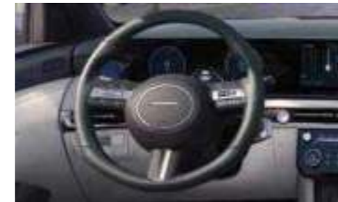
Tilt & Telescopic Steering Wheel