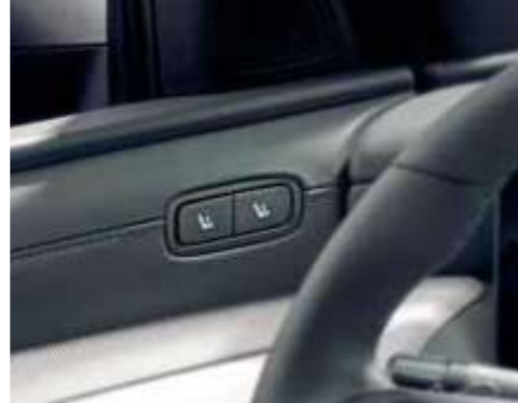
Integrated Memory Seat