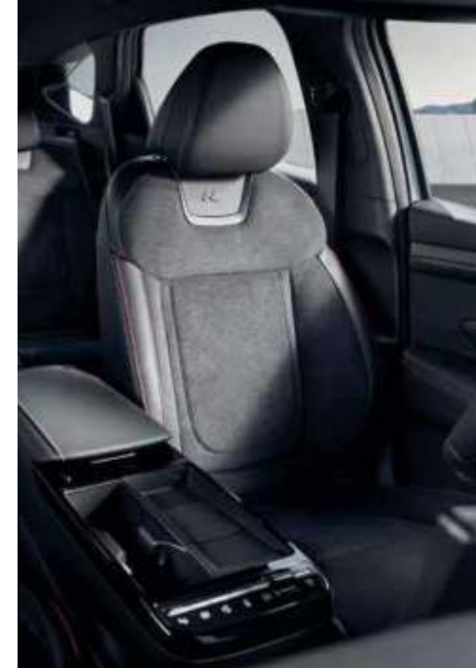
N Line-Exclusive Suede Seats