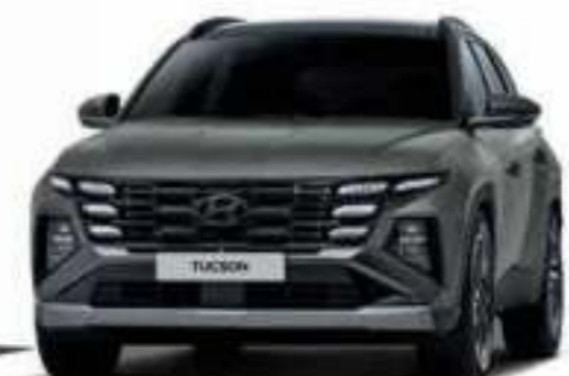
1.6 Turbo GDI