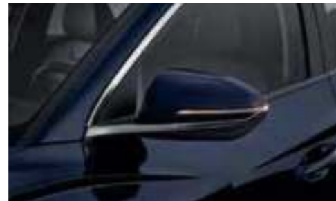
Turn Signal Indicator LED Outside Mirror