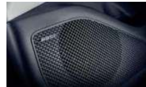
BOSE Premium Sound System