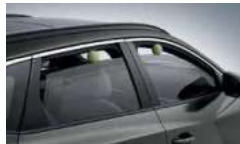
Safety Power Window