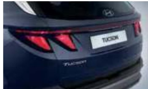
Rear Combination Lamps (Bulb Type)