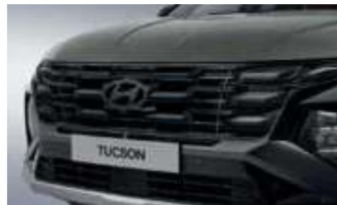
Dark Tinted Chrome Radiator Grille (Hidden Lighting DRL)