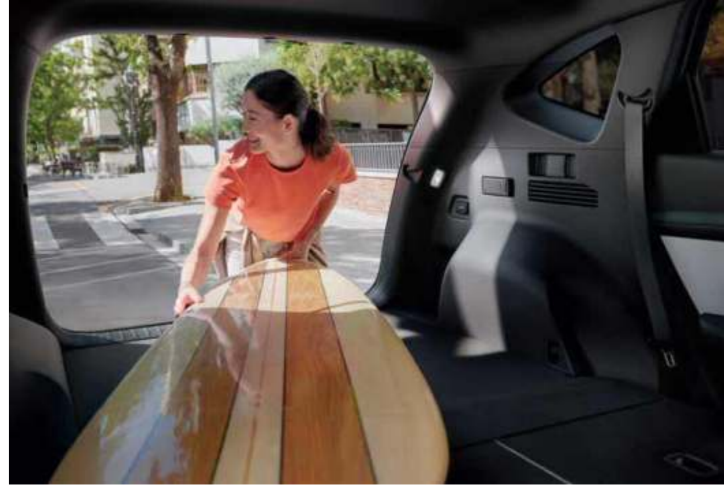
Folding Seats / Remote Folding System