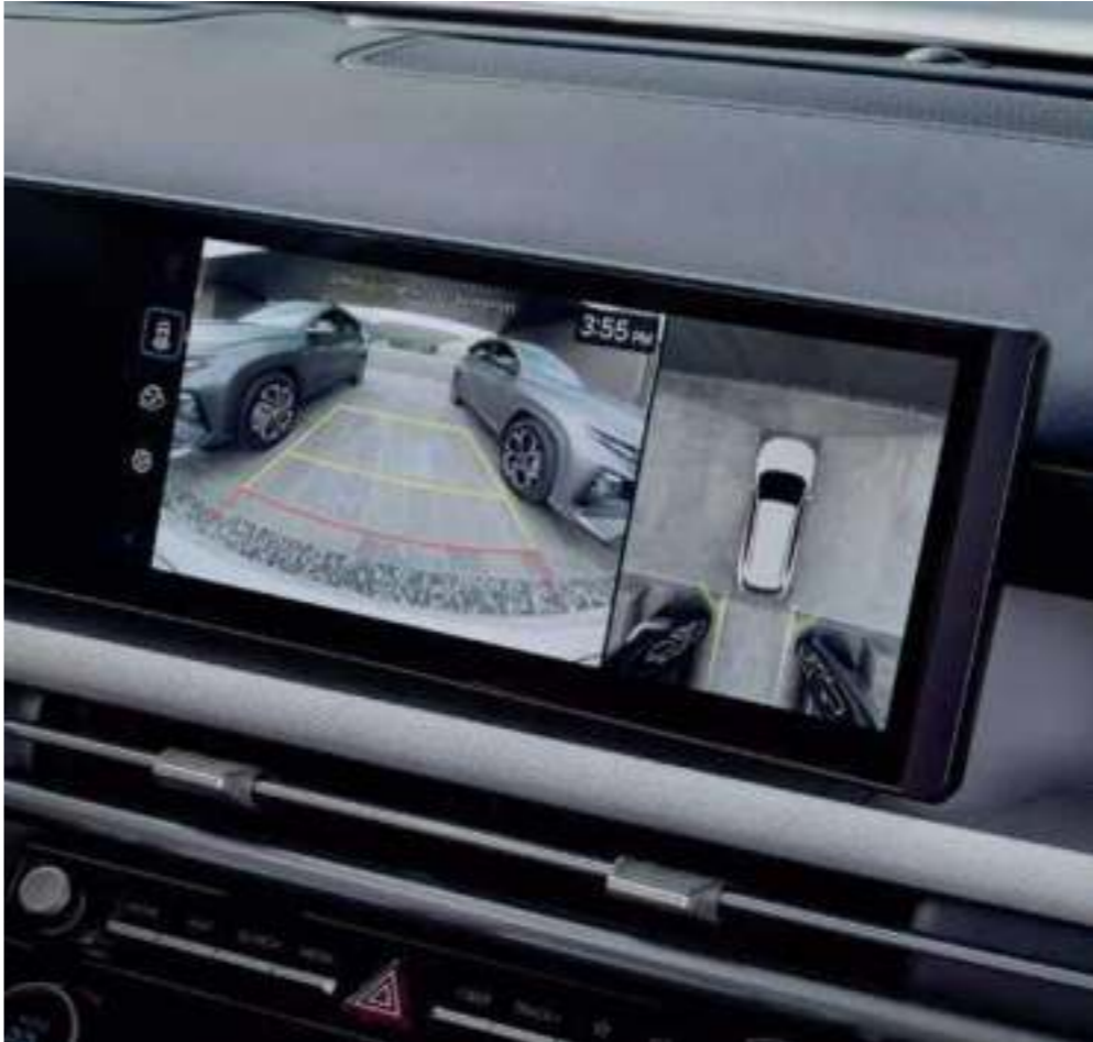
Surround View Monitor (SVM)