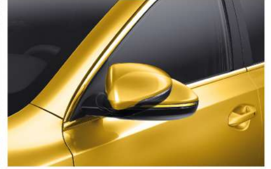
إشارات بالمرآيات الجانبية + طي كهربائياً Electric Folding Outside Mirrors + Side Repeaters