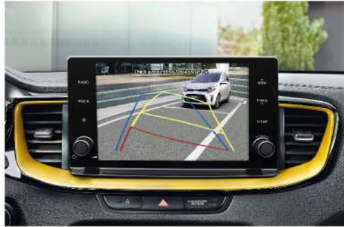
شاشة لمس مقاس ٨ بوصة + كاميرا خلفية 8-inch Touch Screen + Rear View Camera