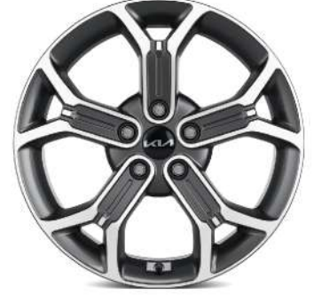
18" Alloy Wheel 234/45