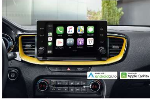
تدعيم Apple CarPlay & Android Auto Supporting Android Auto & Apple CarPlay