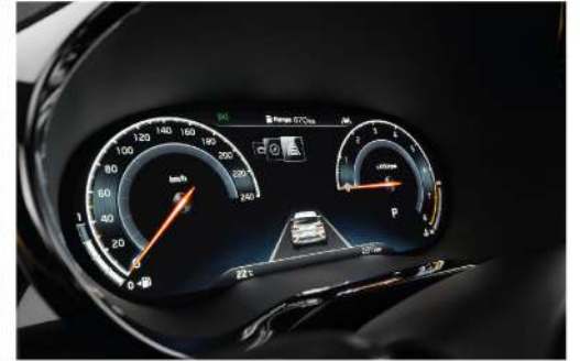
لوحة عدادات ديجيتال مقاس ١٢,٣ بوصة 12.3-inch Digital Cluster Screen