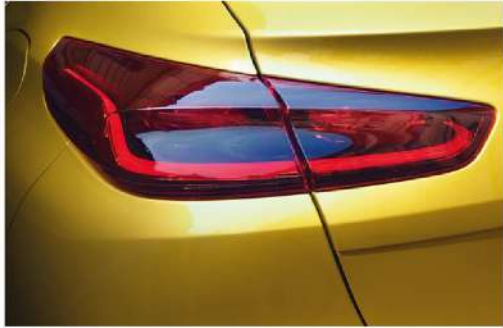
مصباح خلفية LED Rear Combination Lamp LED Type