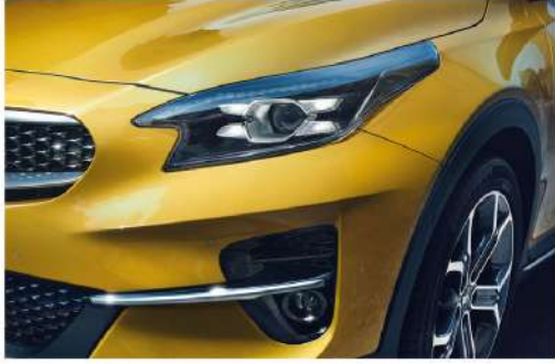
مصباح أمامية LED بعدسة ثنائية الإضاءة LED Bi-Projection Headlamps