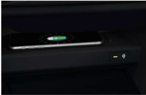
شاحن لاسلكي للهاتف الذكي Wireless Smart Phone Charger