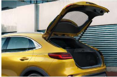
تحكم كهربائي في فتح وغلغ صندوق الأمتعة Smart Power Tailgate