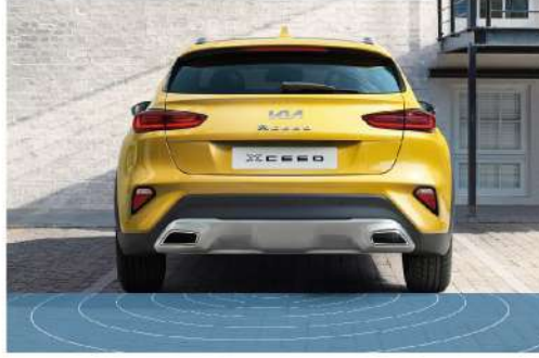
حساس ركن خلفي Rear Parking Assist System