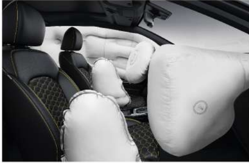
وسائد جانبية مدمجة بالكراسي ووسائد هوائية للسائق والراكب الأمامي 6 Airbags (Driver, Passanger, Side Front & Curtains)