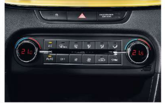
تكييف هواء أوتوماتيك ثنائي التبريد Dual Zone Auto Air Conditioner with Cluster Ionizer