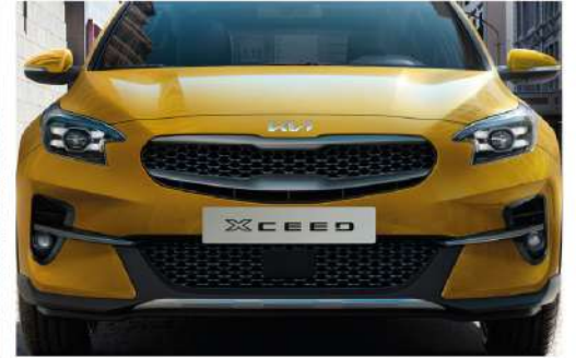
شبكة أمامية بالكروم اللامع High Gloss Chrome Radiator Grill