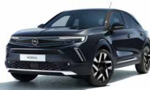
Diamond Black Elegance