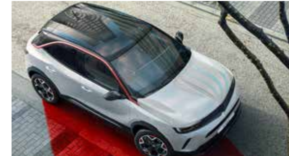
05 GS Line Features & Equipments