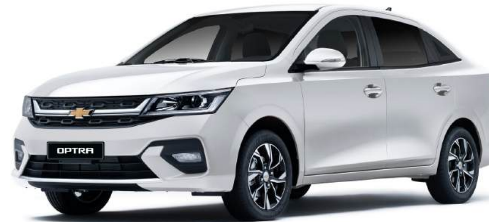
Casablanca White ● أبيض