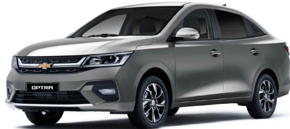
Urban Gray ● رمادي فاتح