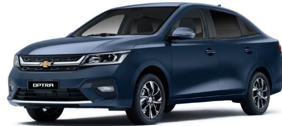
Persian Blue ● أزرق