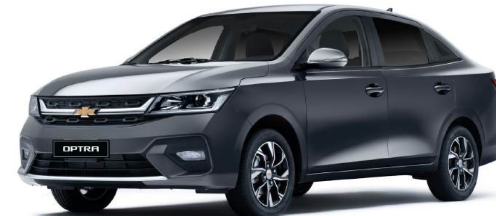
Dark Denim Gray ● رمادي غامق