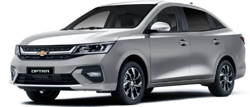
Poly Silver ● فضي