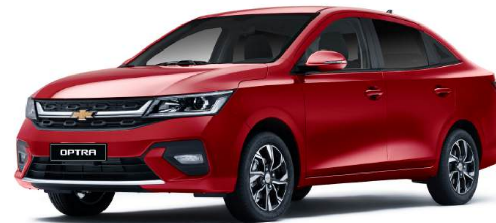
Flame Red ● أحمر