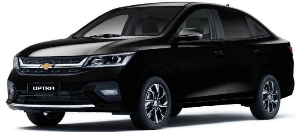
Pearl Black ● أسود