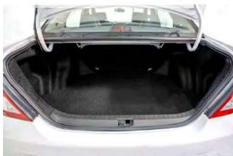
مساحة خلفية واسعة