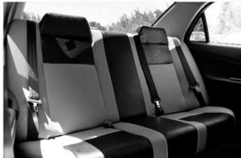
كراسي خلفية تتسع لثلاث ركاب