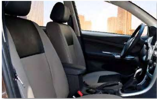
كراسي أمامية قابلة للتعديل