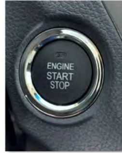
نظام المفاتيح الذكي (مفتاح بصمة)