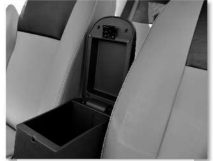
مخدع يد مزود بصندوق تخزين