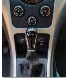
ناقل حركة أوتوماتيك