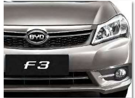
شبكة أمامية كروم ذات تصميم عصري