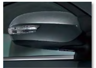
إشارات بالمرابيات الجانبية