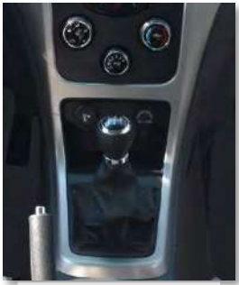
ناقل حركة يدوي

راديو / USB / مدخل صوت خارجي AUX - تكييف هواء - باور ستيرنج - عجلة قيادة قابلة للتعديل