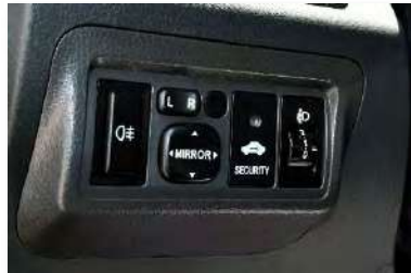
نظام إيموبيليزر- فوانيس شبور- مرابيات جانبية كهربائية