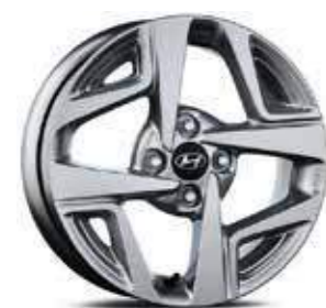
15" Alloy Wheel