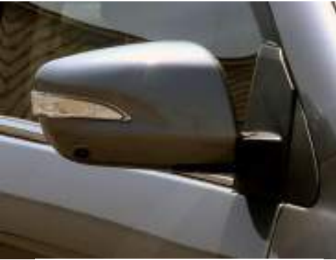
إشارات بالمرائيات وكاميرا بالجانب الأيمن