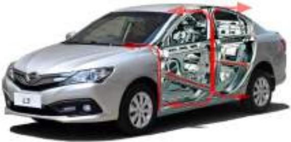
دعامات فولاذية بالأبواب