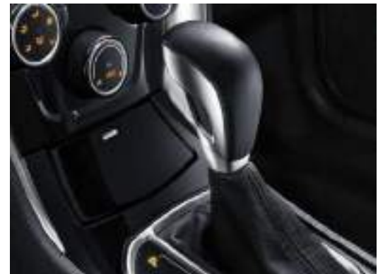
ناقل حركة أوتوماتيكي