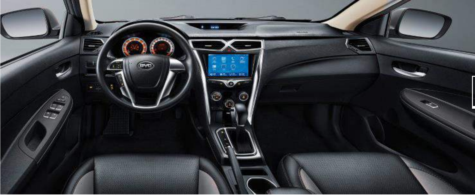
شاشة وسائط متعددة بمدخل صوت خارجي AUX, USB, Bluetooth - تكييف هواء - باور ستيرنج - عجلة قيادة قابلة للتعديل