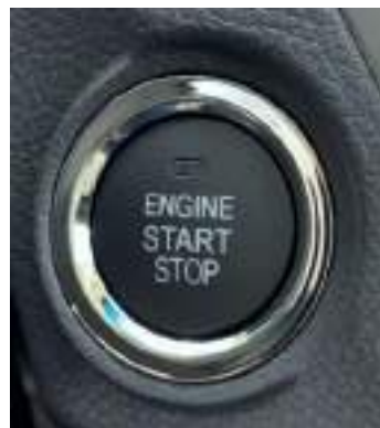
نظام تشغيل بدون مففتاح