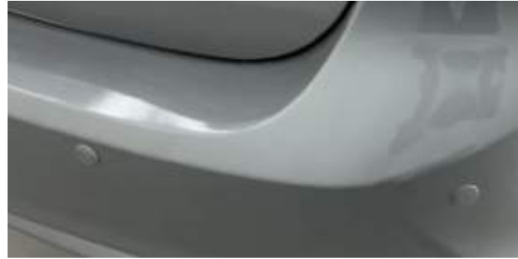
نظام المساعدة على الركن حساسات خلفية - كاميرا خلفية