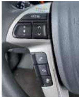
عجلة قيادة متعددة الوظائف