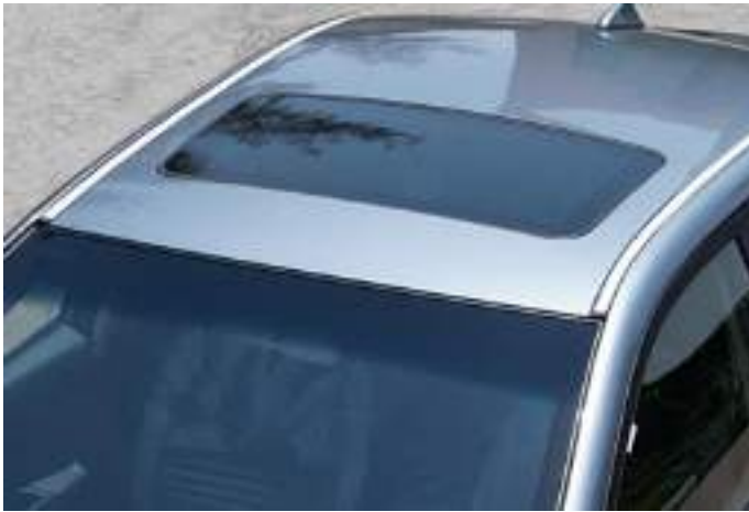
فتحة سقف كهرباء