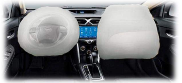
اكياس هواء ذكية للسائق والراكب الأمامي