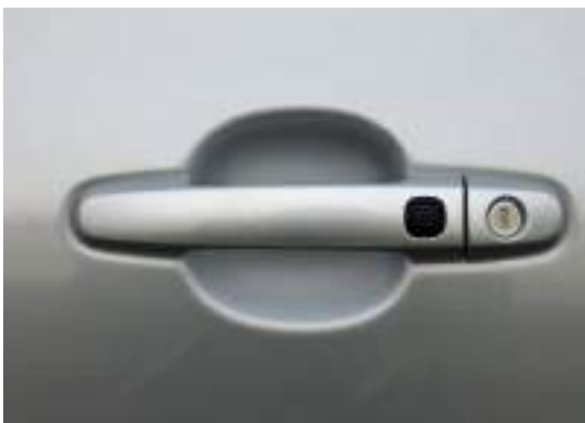
نظام المففتاح الذكي - مففتاح بصمة