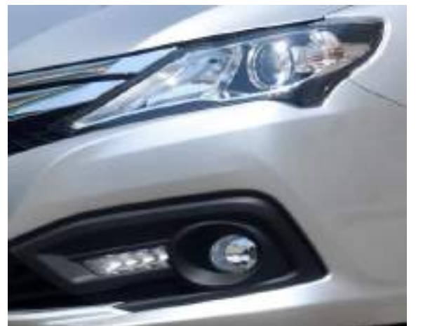
إضاءة نهائية - فوانيس شبوراة